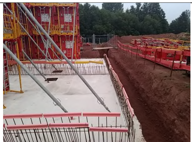
Radier des SBR coulé