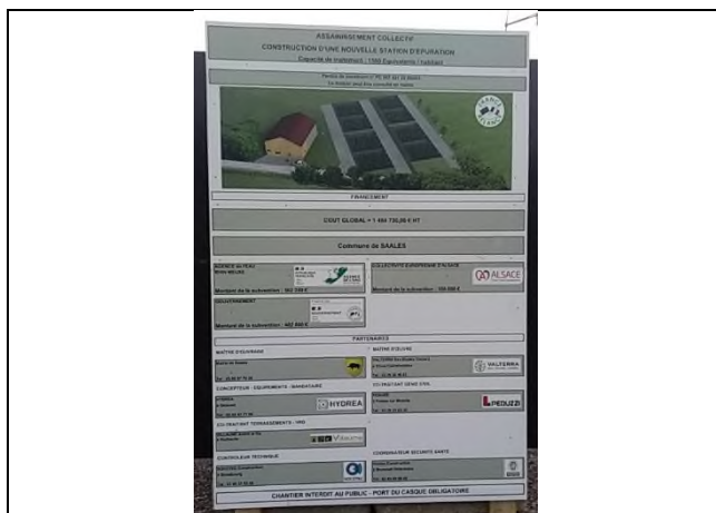
Le panneau de chantier posé

Le panneau de chantier a été posé à l'entrée de la STEP.