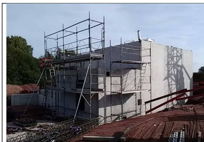
Voiles des locaux surpresseur et électrique coulés

Ferrailage du regard de répartition en cours.