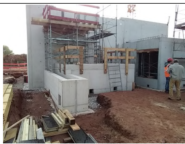
Ferrailage du regard de répartition en cours

Semaine prochaine : L'entreprise VILLAUME interviendra pour la pose des différents réseaux enterrés et la mise en place du Poste Toutes Eaux (PTE).