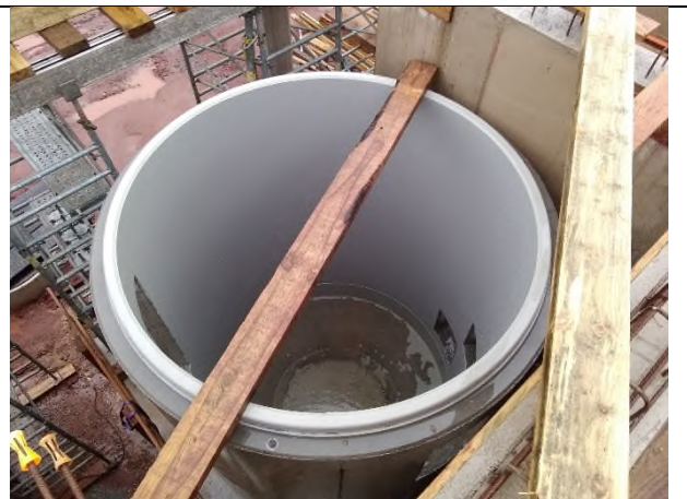
DDC à démonter (réservations non conformes)

L'entreprise HYDREA fournit à PEDUZZI les manchettes pour les traversées des parois. Préparation du ferrailage du dégrilleur.