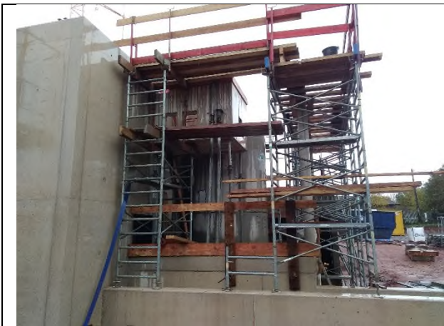
Regard de répartition coulé

Le DDC a été livré mais il est non conforme par rapport projet. Il sera remplacé, ce qui implique un retard dans l'organisation de PEDUZZI.