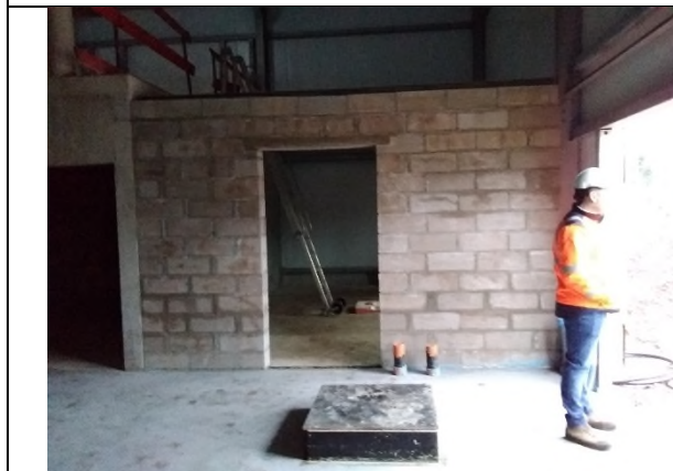
Dallage béton et mur en parpaing terminés