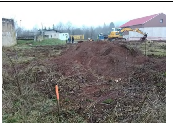
Préparation pour implantation des lits de séchage