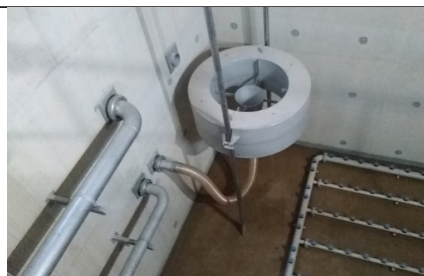
Equipement des casiers SBR terminé